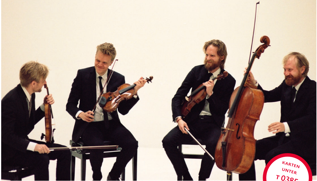
Danish String Quartet