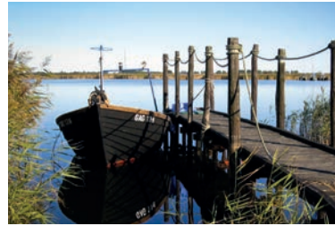
Landschaft in Vorpommern