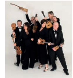
The Ukulele Orchestra of Great Britain